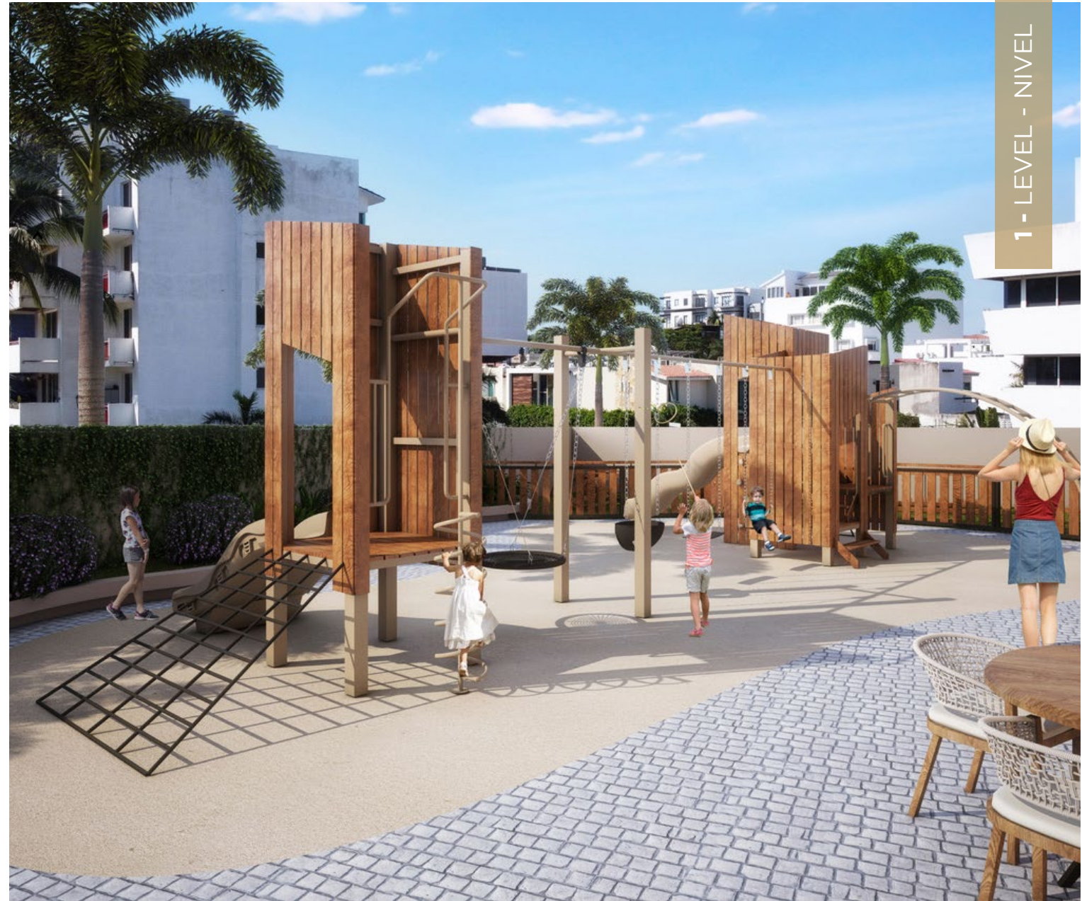
Indoor and Outdoor Recreational Area and Pet Park.

The Developer reserves the right to modify colors, materials, services, floor plans, prices and terms without prior notice. The furniture and landscaping are decorative suggestions only. El desarrollador se reserva el derecho de modificar los colores, materiales, servicios, planos, precios y términos sin previo aviso. El mobiliario y la jardinería son sugerencias decorativas.