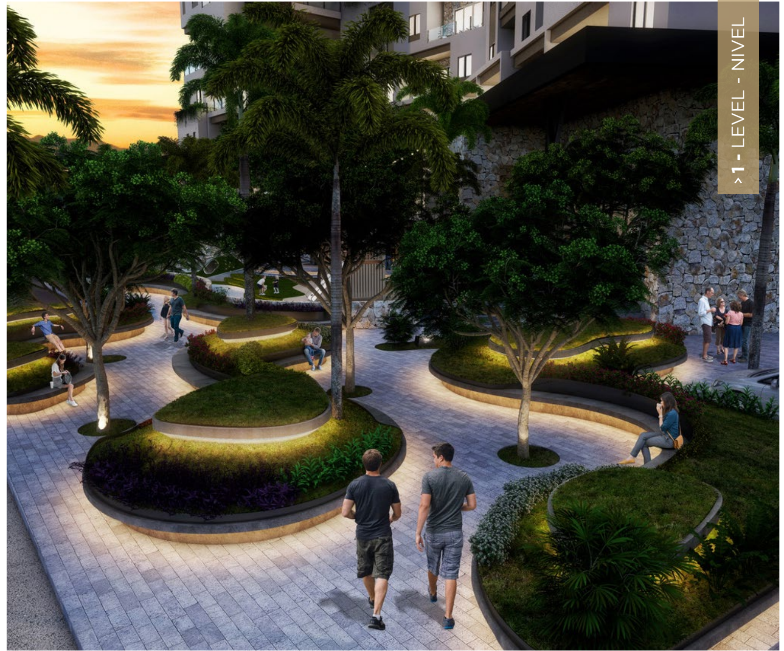
Abundant, Outdoor Green Spaces in Resting Area. Abundantes espacios verdes al aire libre en el área de descanso.

The Developer reserves the right to modify colors, materials, services, floor plans, prices and terms without prior notice. The furniture and landscaping are decorative suggestions only. El desarrollador se reserva el derecho de modificar los colores, materiales, servicios, planos, precios y términos sin previo aviso. El mobiliario y la jardinería son sugerencias decorativas.