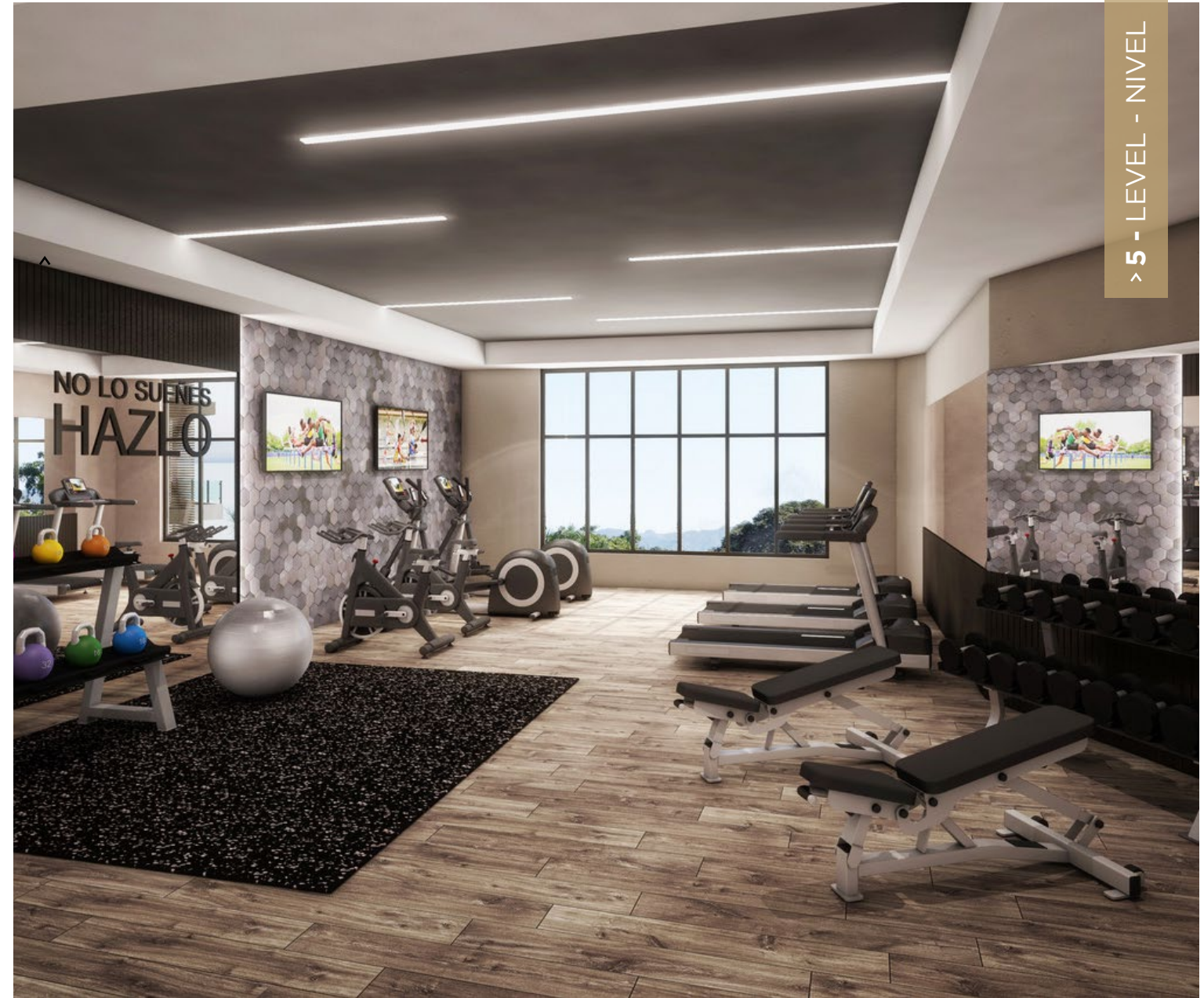
Fully equipped gym with A/C.

The Developer reserves the right to modify colors, materials, services, floor plans, prices and terms without prior notice. The furniture and landscaping are decorative suggestions only. El desarrollador se reserva el derecho de modificar los colores, materiales, servicios, planos, precios y términos sin previo aviso. El mobiliario y la jardinería son sugerencias decorativas.