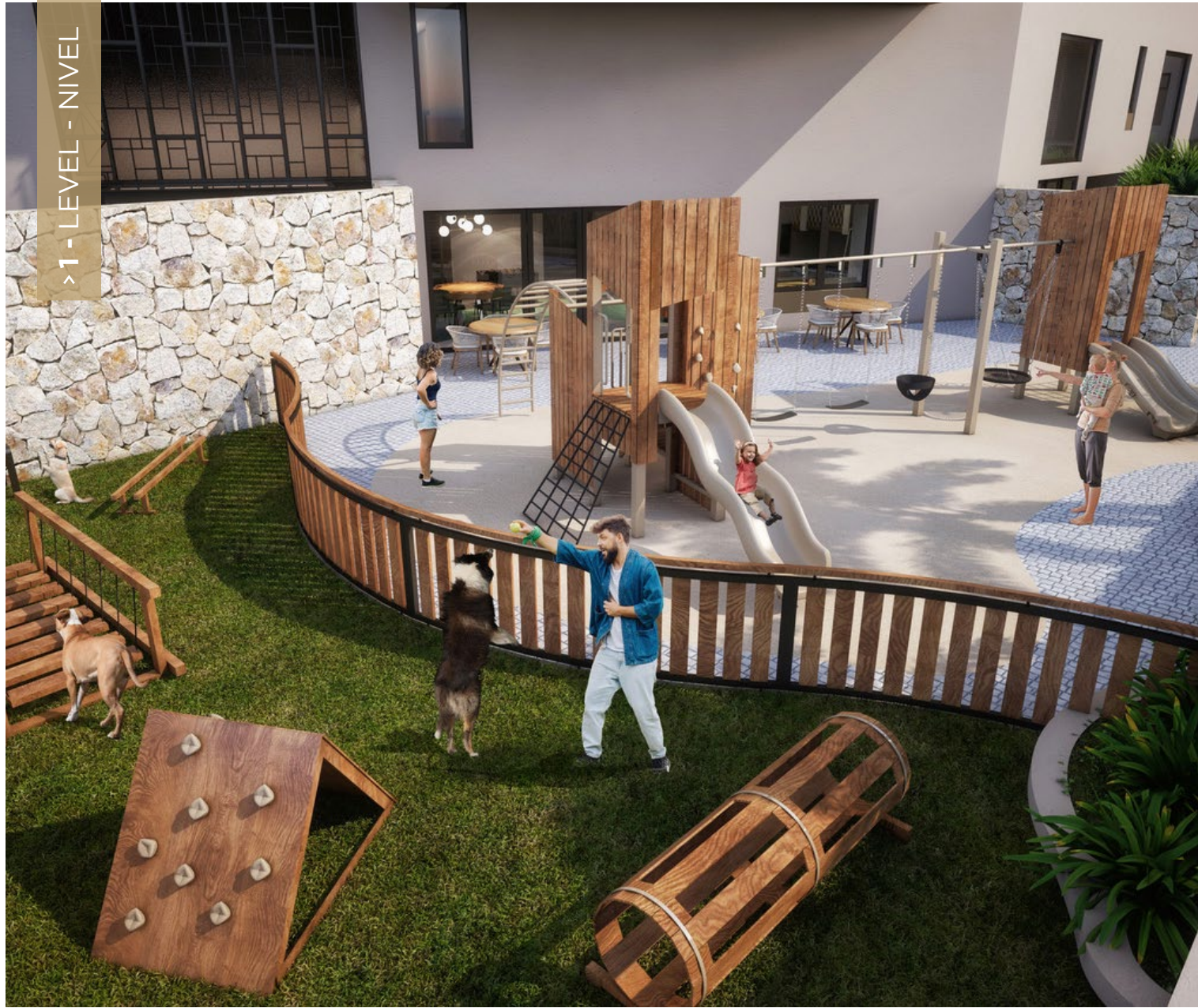
Pet Park. Parque para mascotas.

The Developer reserves the right to modify colors, materials, services, floor plans, prices and terms without prior notice. The furniture and landscaping are decorative suggestions only. El desarrollador se reserva el derecho de modificar los colores, materiales, servicios, planos, precios y términos sin previo aviso. El mobiliario y la jardinería son sugerencias decorativas.