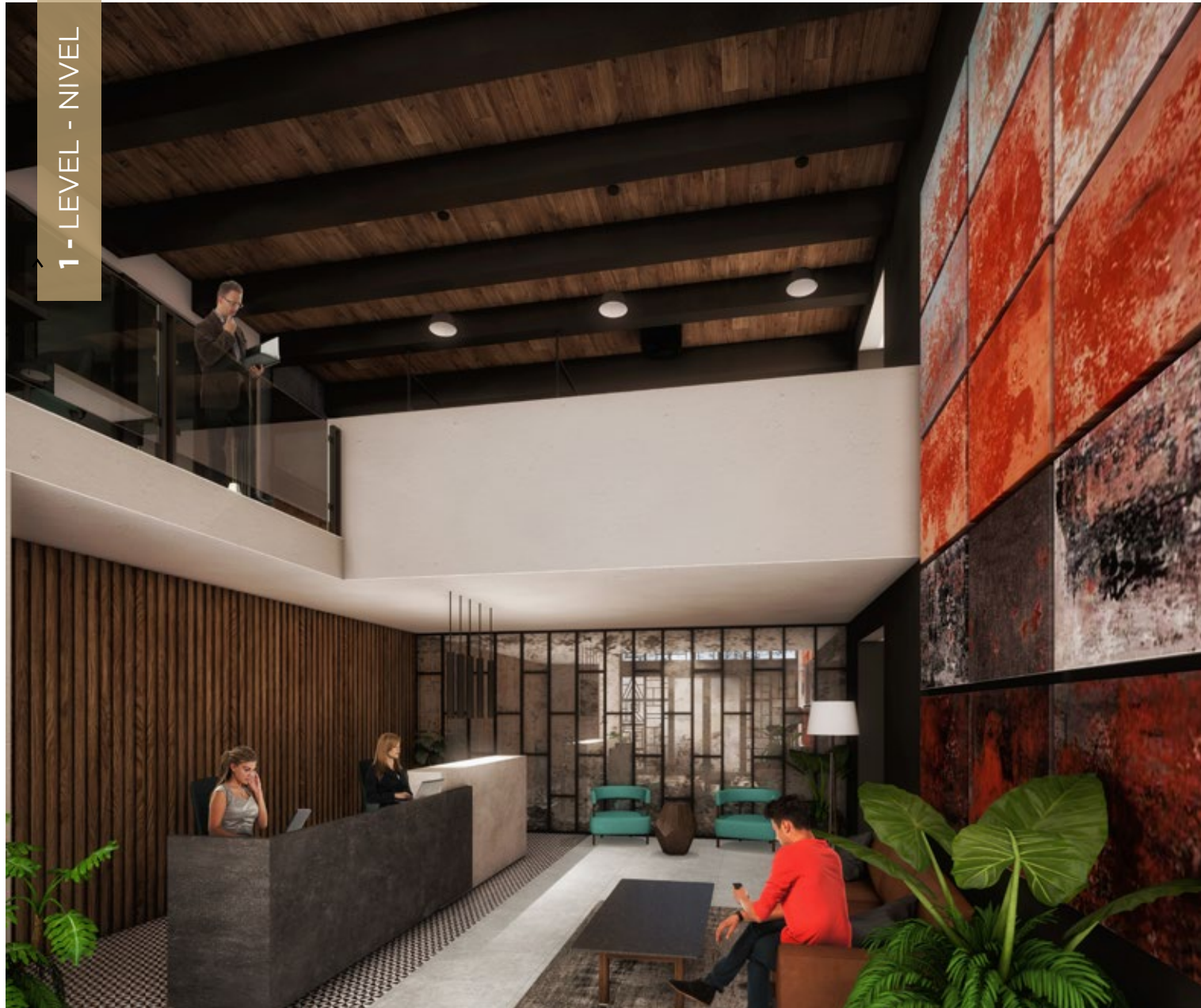
Entrance to Lobby on Havre St. Controlled access reception. Double-height lobby.