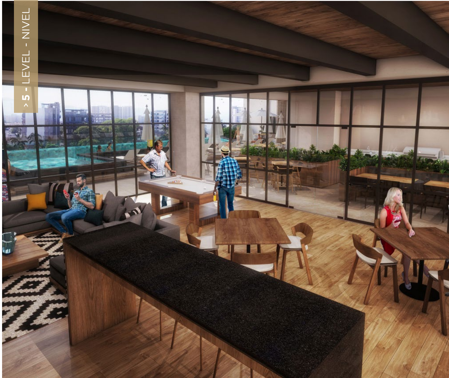
Infinity Pool, BBQ Área and Air-Conditioned bar and lounge & Gym.